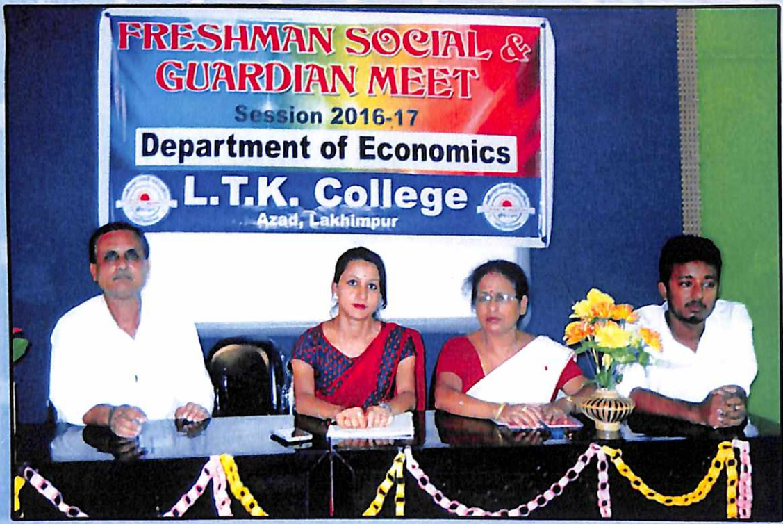
অর্থনীতি বিভাগৰ অধ্যাপক অধ্যাপিকা সকল