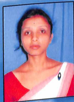
গিতুয়নি বৰা প্ৰথম স্থান (২০১৫)