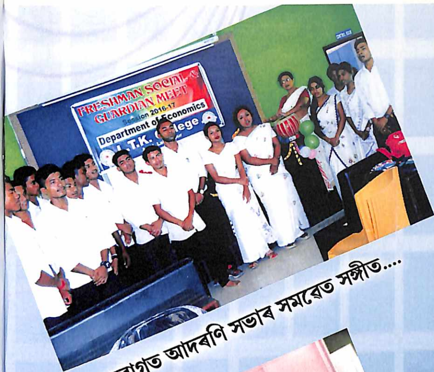
নবাগত আদৰ্শ সভাৰ সমবেত সঙ্গীত....